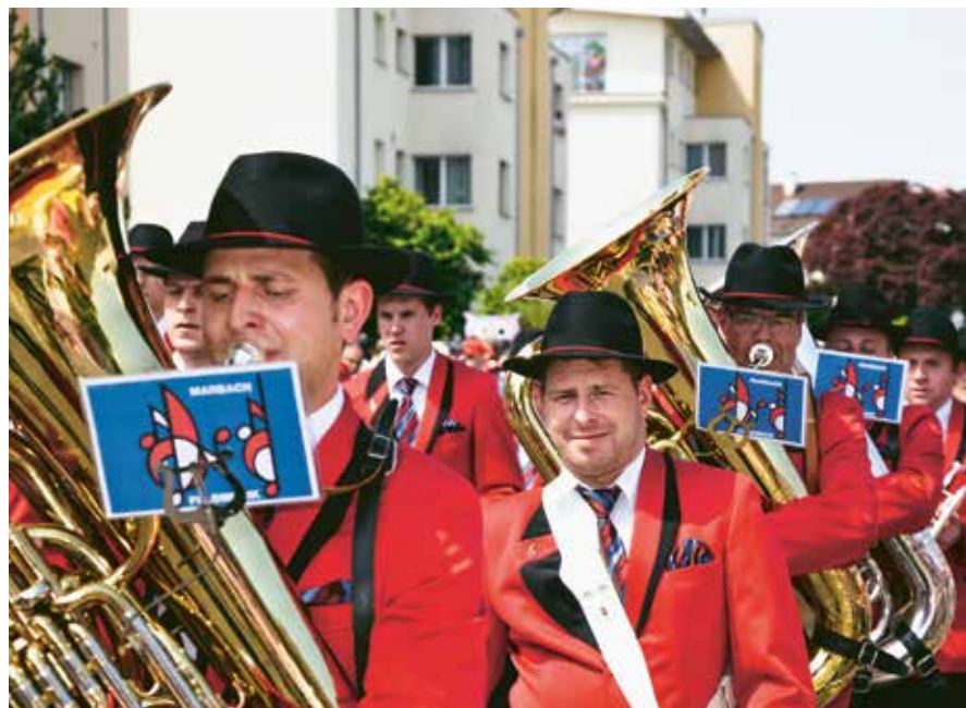
— Taktvoll beschwingt mit der Brass Band Feldmusik Marbach

Die UNESCO Biosphäre Entlebuch ist ein Nah- und Nächsterholungsgebiet für die Bevölkerung. Eine naturverbundene Umgebungsgestaltung schafft Lebensqualität. Bewusst geschaffene Räume bieten den Einwohnerinnen und Einwohnern Raum zum Flanieren und Geniessen. So gibt es beispielsweise viele Natur- und Kräutergärten, Wander- und Spazierwege, Erlebnis- und Lernpfade.