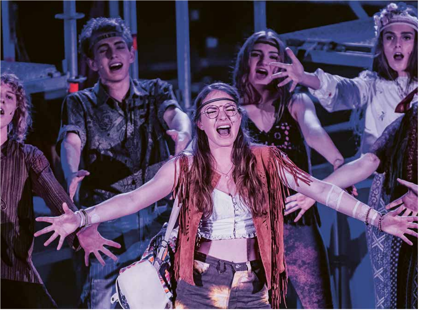
— Die grösste Bühne der Region: Musical «Hair», Aufführung des Vereins Musical Plus mit der Kantonsschule Schüpfheim/Gymnasium Plus