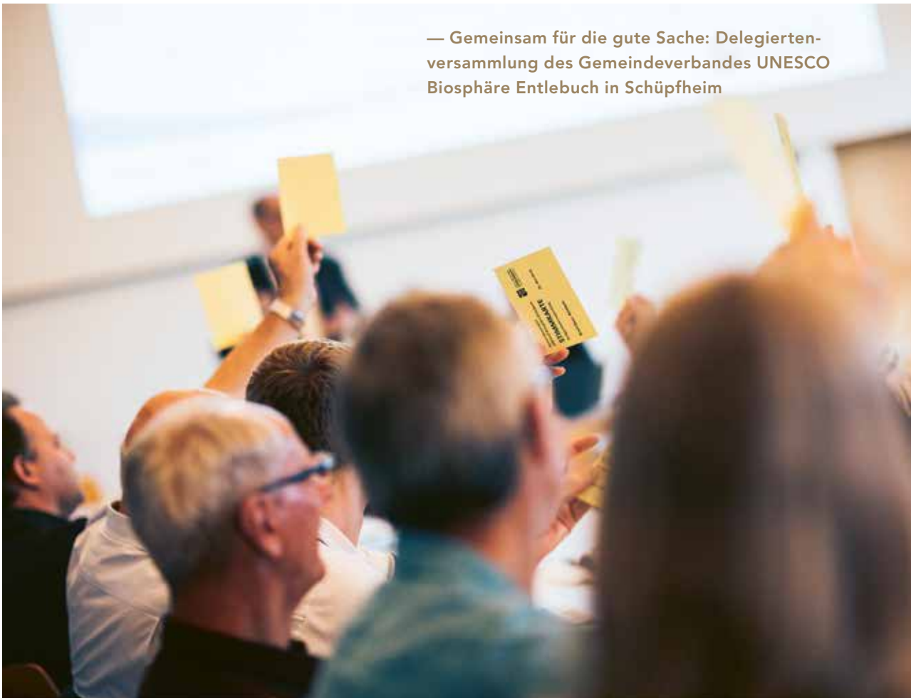
— Gemeinsam für die gute Sache: Delegiertenversammlung des Gemeindeverbandes UNESCO Biosphäre Entlebuch in Schüpfheim

Die Entlebucher sind etwas anders. Und auch das muss so sein. Denn so sind sie einzigartig, kreativ und authentisch. Und so wird auch die UNESCO Biosphäre Entlebuch zur echten Modellregion, die etwas bewegt und eine Vorbildrolle einnimmt. Hier denkt man anders, nimmt sich selber nicht allzu ernst, die Sache dafür umso mehr.