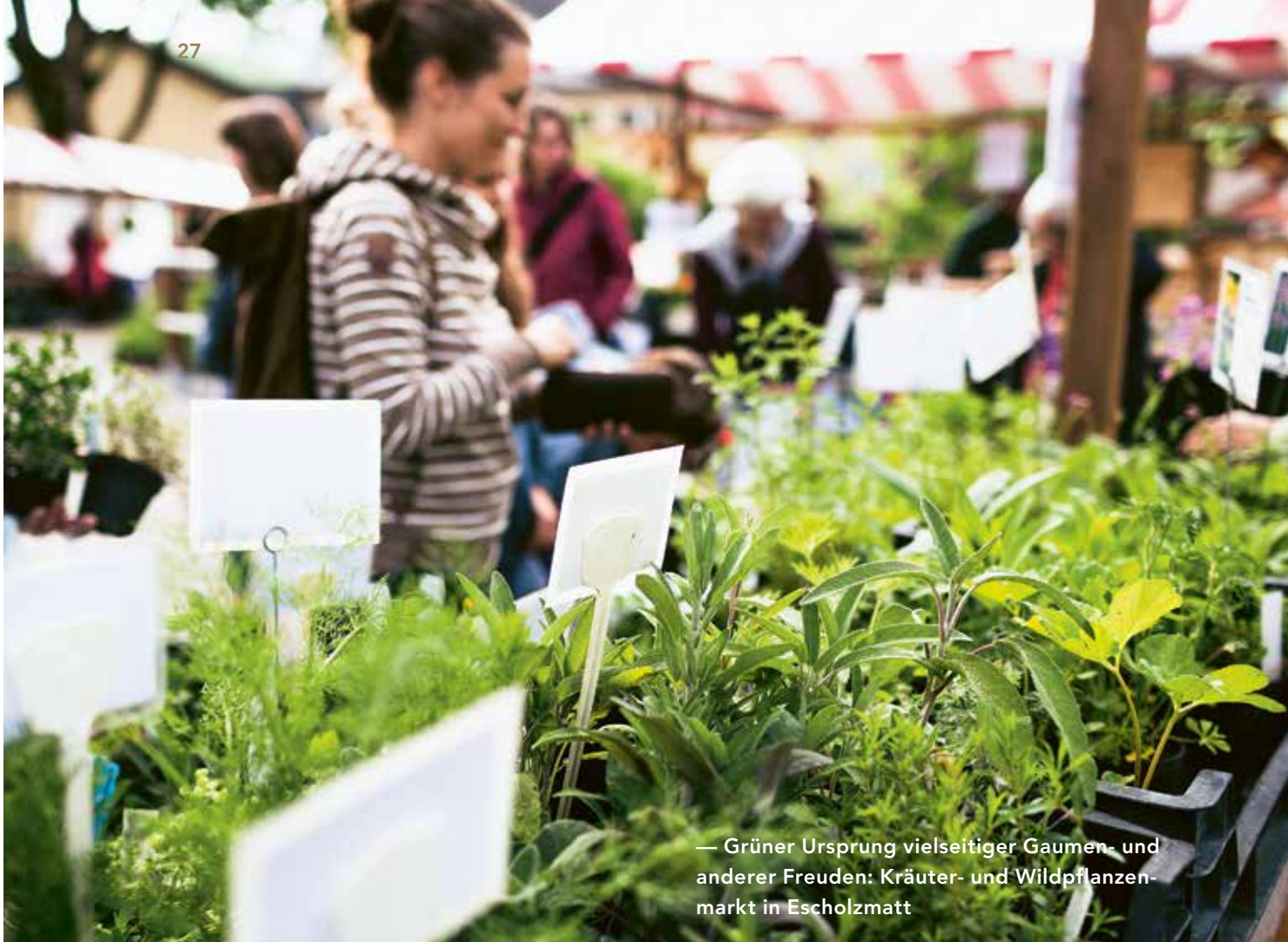
— Grüner Ursprung vielseitiger Gaumen- und anderer Freuden: Kräuter- und Wildpflanzenmarkt in Escholzmatt