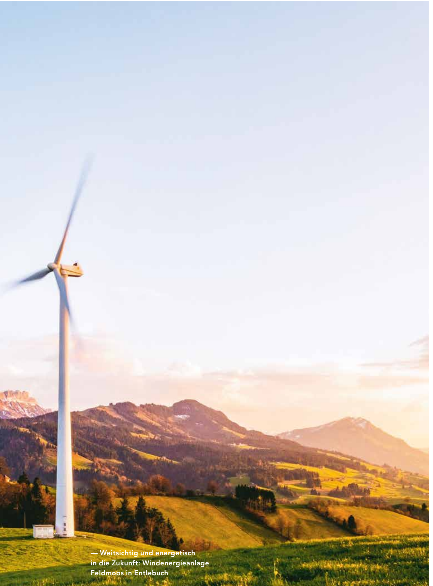
— Weitsichtig und energetisch in die Zukunft: Windenergieanlage Feldmoos in Entlebuch