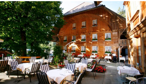
Titel: Unbekannt | Autor: Markus Schluep | Quelle: Quelle Berner Wanderwege